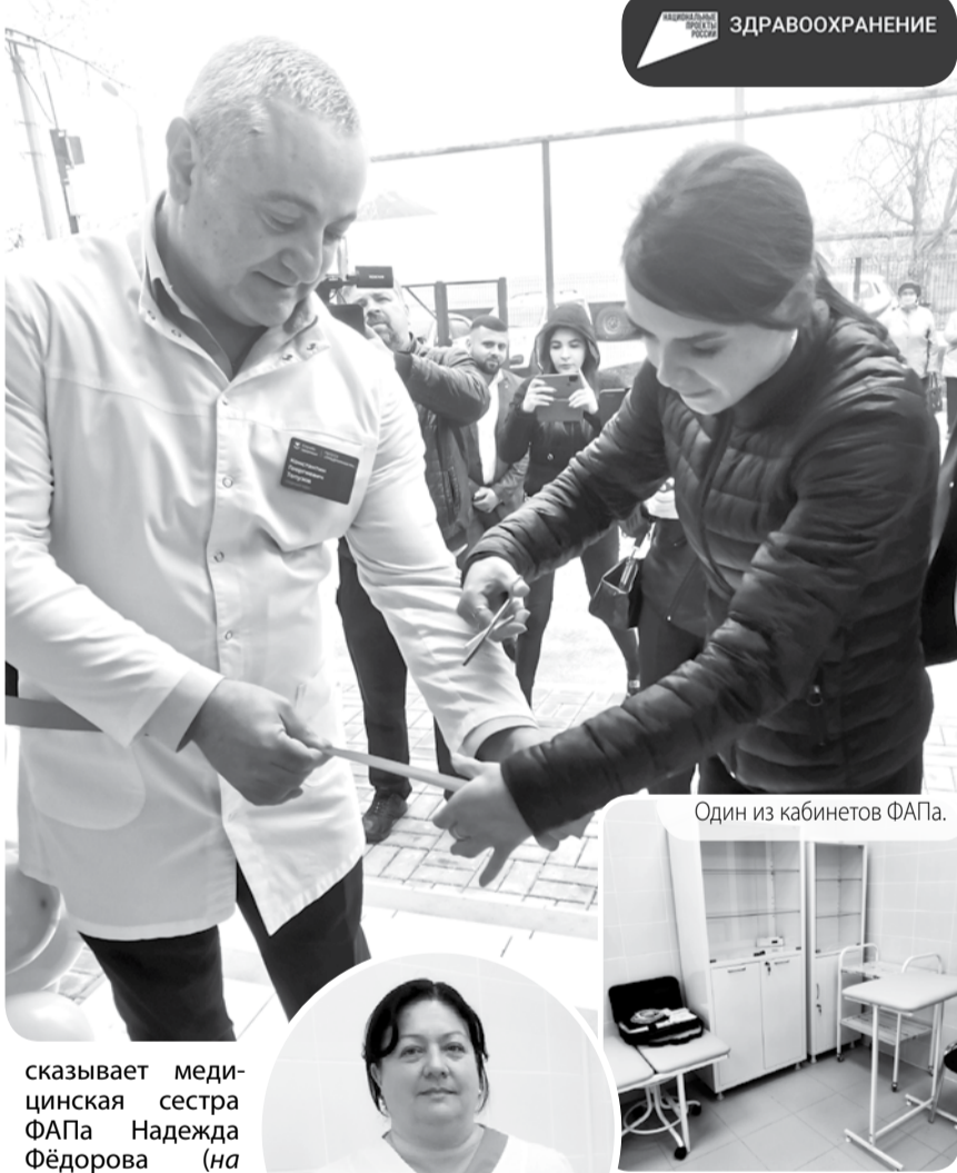
Один из кабинетов ФАПа.

Когда присутствующие зашли внутрь, то обрадовались ещё больше - в кабинетах есть и электрокардиограф, и автоматический дефибриллятор, и пульсоксиметр, и многое другое, что требуется для обследования и лечения пациентов. - Работаю здесь уже много лет, -