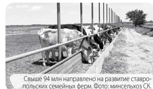
Свыше 94 млн направлено на развитие ставропольских семейных ферм.

– У фермеров есть два года на освоение полученных средств. Специалисты министерства на протяжении всего периода будут оказывать информационно-